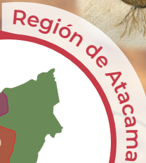
Región de Atacama

Los bulbos son órganos que se mantienen bajo el suelo y sirven para el almacenamiento de nutrientes y también a partir de ellos puede nacer un nuevo individuo.