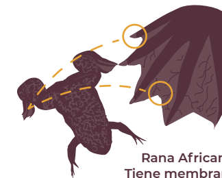
Rana Africana: Tiene membrana interdigital y uñas

Esta especie exótica invasora depreda a otros anfibios, les transmiten enfermedades y compite con ellos por hábitat y alimento.