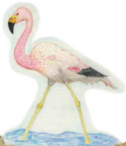
1.- Flamenco Chileno